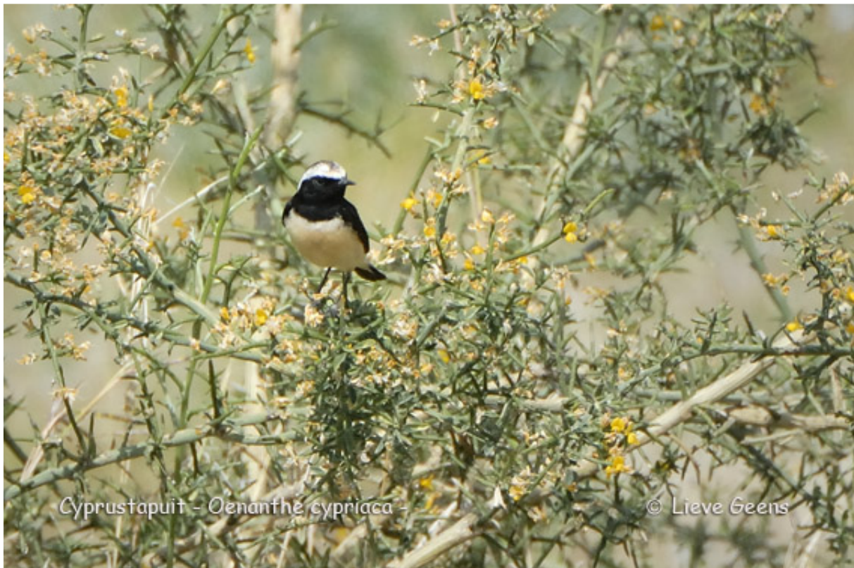
Cyprustapuit - Oenanthe cyprica -